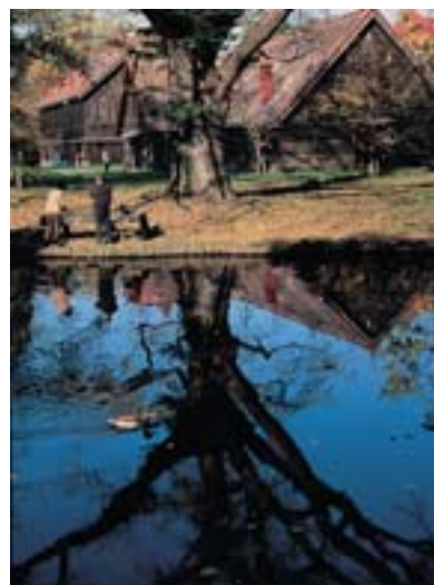
金賞 【コダック/富士フィルム賞】 三浦 純 石狩市 北海道大学 札幌農学校第2農場