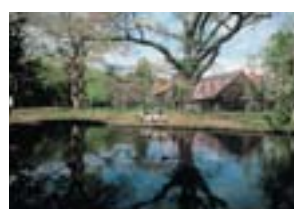
星 光義 札幌市 北海道大学 札幌農学校 第2農場