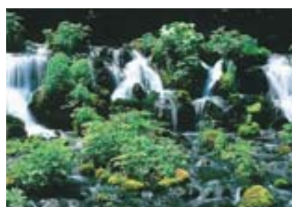
銀賞 【EAST WEST賞/CREATE賞】 松本 輝雄 北広島市 京極のふきだし湧水