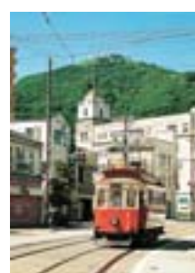
千葉 宏 函館市 路面電車