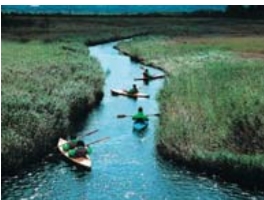
金賞 【コダック/富士フィルム賞】 矢口 勲 札幌市 霧多布湿原