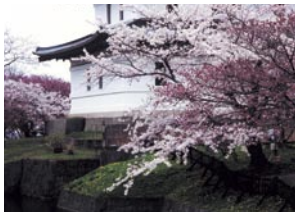
大熊 彰 帯広市 『春爛漫の松前城』 福山(松前)城と寺町