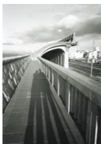
高松 祐子 大阪府堺市 『二人の影 —北防波堤ドーム』 稚内港北防波堤ドーム