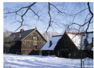
酒井 善章 札幌市 『初雪の農場』 北海道大学 札幌農学校第2農場