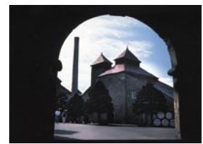
塩谷 進 札幌市 『時をこえて』 ニッカウキスキー余市蒸溜所