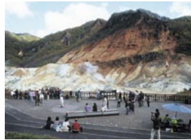
田中 憲弘 苫小牧市 『地獄谷展望台』 登別温泉地獄谷