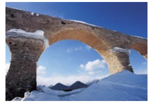
田中 ツヤ子 音更町 『大雪の山と共に』 旧国鉄土幌線コンクリートアーチ橋梁群