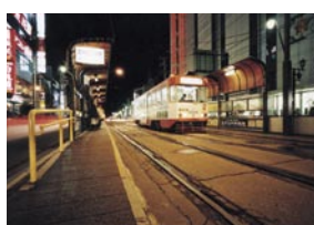
矢野倉 隆 茨城県水戸市 『函館の路面電車』 路面電車