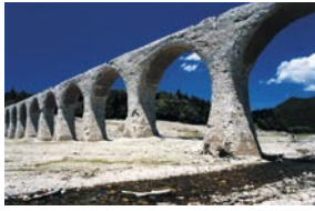
高田 悦也 帯広市 『タウシュベツ橋梁』 旧国鉄土幌線コンクリートアーチ橋梁群