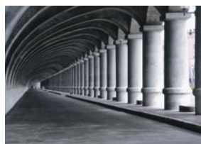
片山 隆 音更町 『稚内港北防波堤ドーム』 稚内港北防波堤ドーム