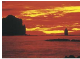
紅露 雅之 小樽市 『カムイ岬暮色』 積丹半島と神威岬