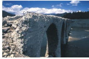
纈纈 政由 上士幌町 『風雪に耐えて』 旧国鉄土幌線コンクリートアーチ橋梁群