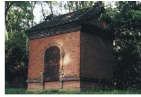
井筒 里志 江別市 『火薬庫』 江別のれんが