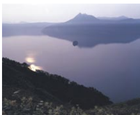
丹羽 明仁 愛知県小牧市 『摩周湖の朝』 摩周湖