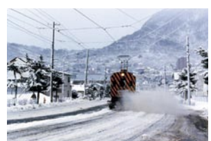
阿部 義博 函館市 『がんばれ函館ササラ電車』 路面電車