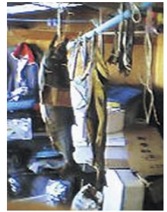
川口 真 標津町 「山漬け鮭とトバ」 サケの文化