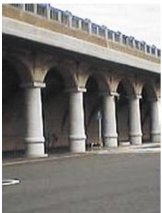
黒澤 恵人 神奈川県横浜市 「稚内港北防波堤ドーム」 稚内港北防波堤ドーム