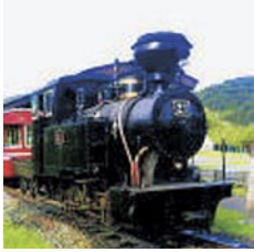
上戸 智仁 丸瀬布町 「森林鉄道雨宮21号」 森林鉄道蒸気機関車「雨宮21号」