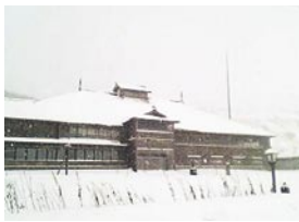
菅原 由加里 留萌市 「雪舞う花田家番屋」 留萌のニシン街道