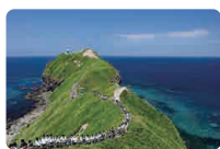
積丹半島と神威岬 積丹観光協会