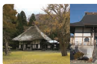
蝦夷三官寺 蝦夷三官寺みらいネットワーク