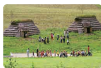
内浦湾沿岸の縄文文化遺跡群 北の縄文道民会議ほか