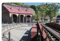
小樽の鉄道遺産 北海道鉄道文化保存会