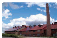
江別のれんが えべつ観光協会