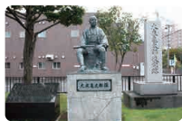
大友亀太郎の事績と大友堀遺構 札幌村郷土記念館