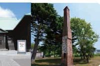
大友亀太郎の事績と大友堀遺構 札幌村郷土記念館