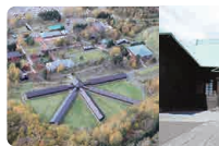
北海道の集治監 網走監獄博物館/月形樺戸博物館/三笠ジオパーク