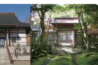
蝦夷三官寺 蝦夷三官寺みらいネットワーク