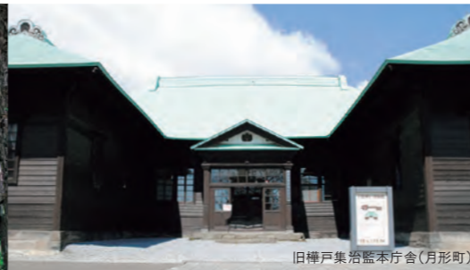
旧樺戸集治監本庁舎(月形町)

【問い合わせ先】 石狩市企画経済部企画課 TEL:0133-72-3161 増毛町商工観光課 TEL:0164-53-3332