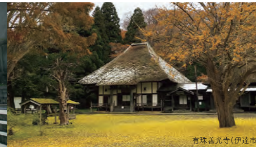
有珠善光寺(伊達市)

【問い合わせ先】 札幌軟石ネットワーク TEL:011-591-8734(石山まちづくりセンター内)